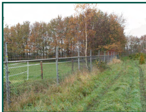
Geheel voorzien van afrastering