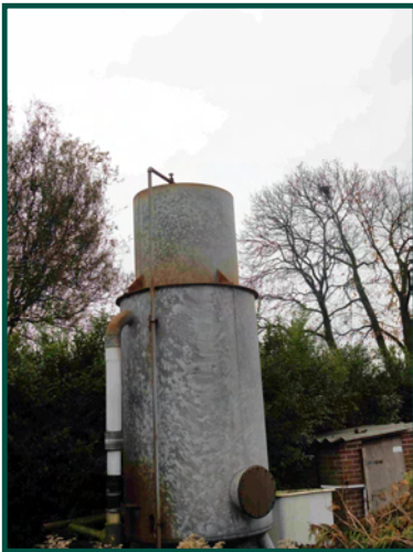
Ontijzeringssilo met beregeningsinstallatie