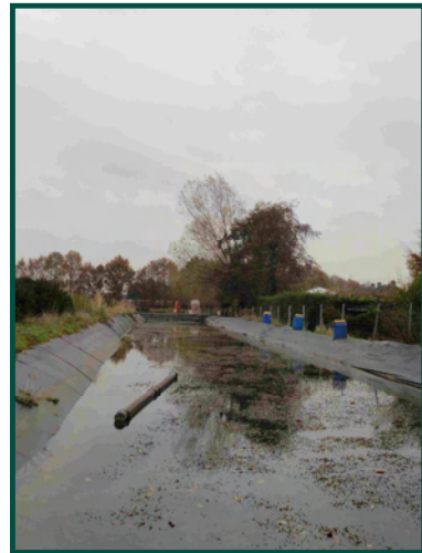
Waterbassin met zuurstofplanten