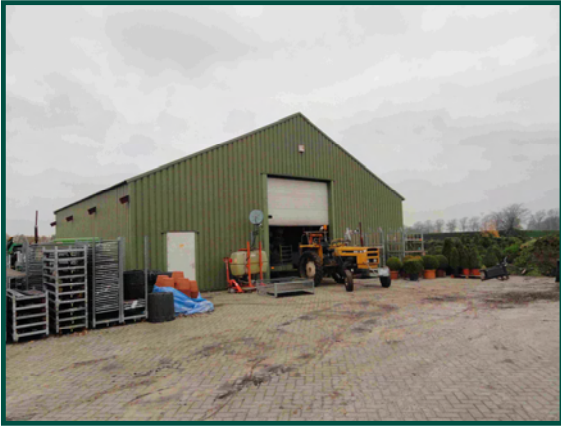
Erf met loods